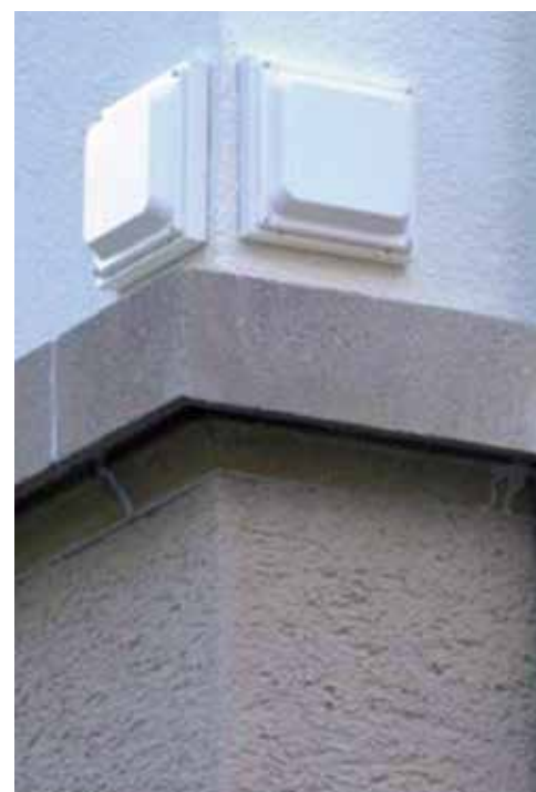
Kleinstzellen an Häuserfassade

Zum Abschluss standen Herr Künzle und Herr Hensinger für die Fragen und Anregungen der rund 70 Besucher der Veranstaltung zur Verfügung.