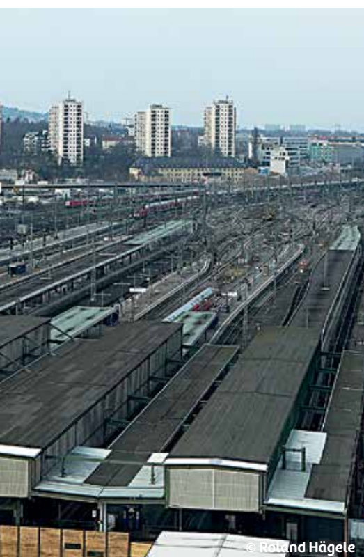
Gleisvorfeld am Hauptbahnhof Stuttgart

Wir sagen, die Auseinandersetzungen um Stuttgart 21 haben bewiesen, dass es auch anders geht: Die Bürger_innen sind die Experten. Die Bürger_innen Stuttgarts dürfen jetzt nicht warten, bis unsere Zukunft verbaut ist.